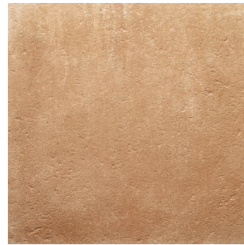
ARIZONA CORAL ****