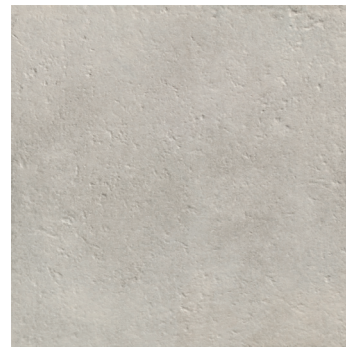
ARIZONA FOG ****