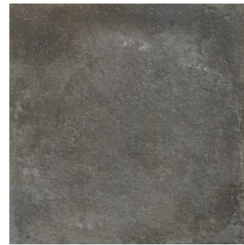
ARIZONA ANTRACITE ***