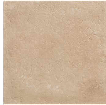
ARIZONA BEGE ****