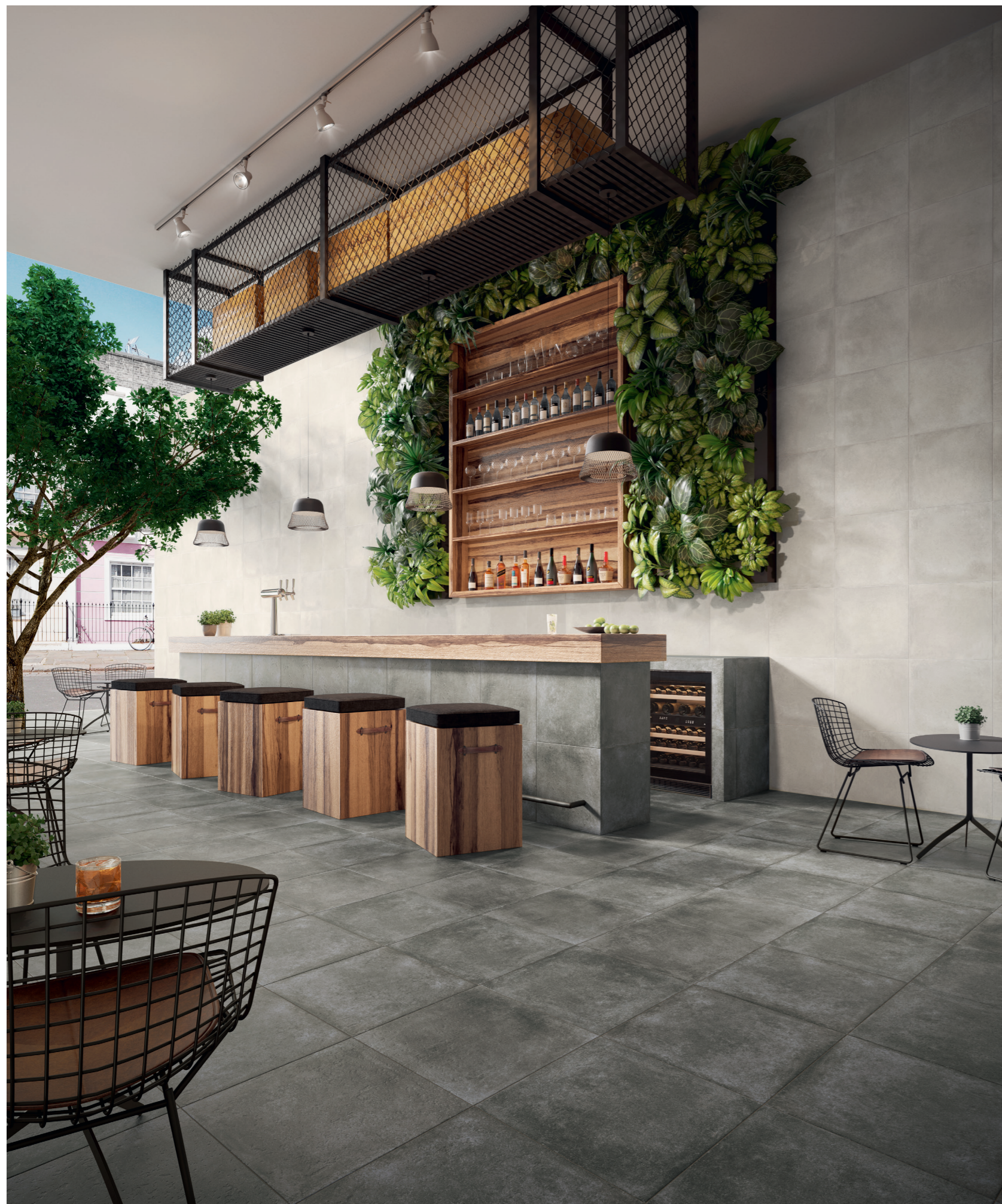
ARIZONA FOG _ ARIZONA ANTRACITE