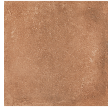
ARIZONA BRICK ****