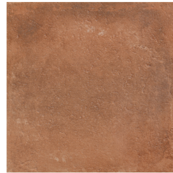
ARIZONA TERRACOTTA ****